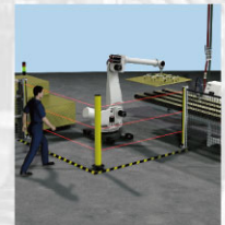
人员侵入防护在工厂自动化中使用