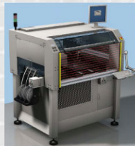
手指和手部安全防护, 在抓取和放置设备或手工操作设备中使用