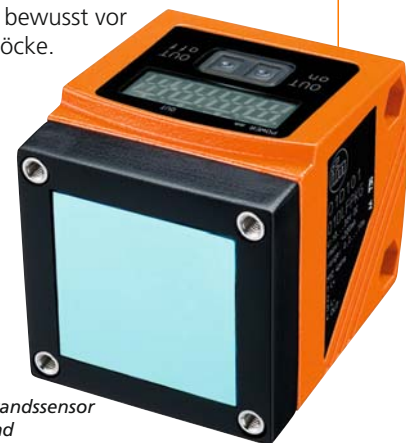
Laser-Abstandssensor efector pmd

Und so funktioniert's: Die Blöcke fahren zunächst bewusst vor die Prellböcke.