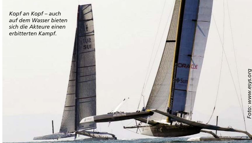
Kopf an Kopf – auch auf dem Wasser bieten sich die Akteure einen erbitterten Kampf.

Weitere Informationen: www.ifm.com/de/news051006