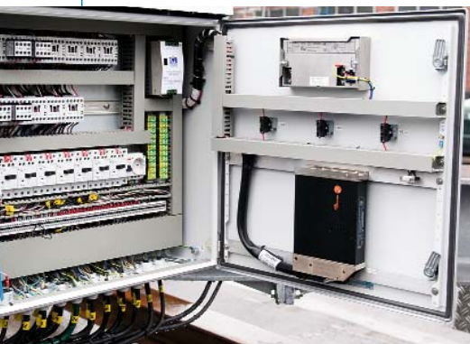
Die Mobilsteuerung R360 steuert die Funktion der Fahrgondel.

Hier finden Sie weitere Produktinformationen: www.ifm.com/de/news051002