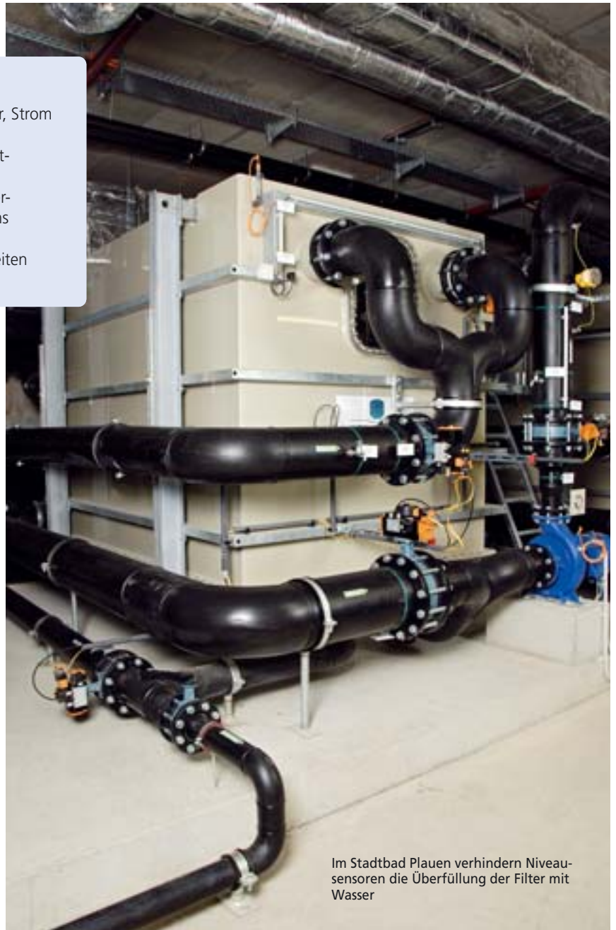
Im Stadtbad Plauen verhindern Niveausensoren die Überfüllung der Filter mit Wasser

Ohne Steigerung der Energieeffizienz hätte das Unternehmen am Standort Tettngang im Jahr 2007 rund 400 000 kWh mehr verbraucht. Dies entspricht Mehrkosten von etwa 33 000 Euro und eine um 250 Tonnen höhere CO 2 -Emission. Während im Jahr 1999 der Stromverbrauch in kWh bezogen auf die produzierte Einheit 1,33 betrug (bei 0,064 Euro/kWh), konnte der Faktor bis 2007 auf 1,26 (bei 0,083 Euro/kWh) gesenkt werden. In der Gesamtbetrachtung der erzielten Einsparungen in Bezug auf Strom, Wasser und Heizung ist zusätzlich der im Laufe der Jahre