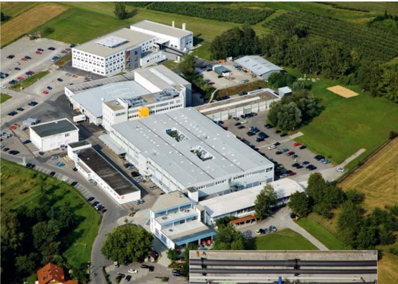
ifm-Standort Tettnag: Energieeffizienz-Maßnahmen und Gebäudeautomation ermöglichen Einsparungen bei Strom, Wasser und Heizung

Mit Hilfe geeigneter Sensorik lassen sich Verluste in der Druckluftversorgung reduzieren