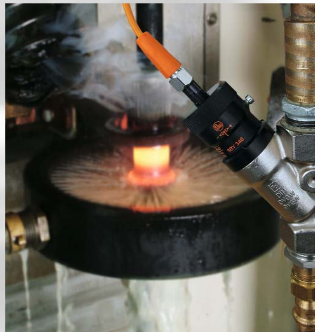
Mechatronischer Sensor im Kühlwasserkreislauf eines Induktionsofens.

Über eine Einstellschraube lassen sich die Schaltpunkte einfach einstellen und fixieren. Die robuste mechanische Ausführung lässt den Einsatz in rauer Umgebung zu. Die Geräte sind wartungsfrei.